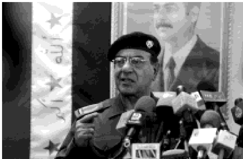
Bagdad Bob può dirvi che il nero in realtà è bianco, ma voi siete liberi di non credergli

3 Dieci anni dopo, persino il computer Apple più cool, con tutti i gigabyte che qualsiasi umano vorrebbe avere, è ancora stupido.