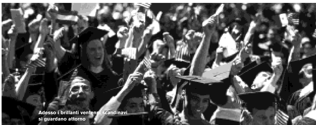
Adesso i brillanti ventenni scandinavi si guardano attorno

16 Aveva torto. Soltanto 51 nazioni hanno vinto una medaglia d'oro, ma il punto è ancora valido. Sta diventando sempre più difficile vincere l'oro in atletica o nella produzione di automobili.